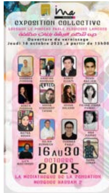
"Lorsque le pinceau parle plusieurs langues", 2025 Médiathèque de la fondation mosquée Hassan II (Casablanca, Maroc)