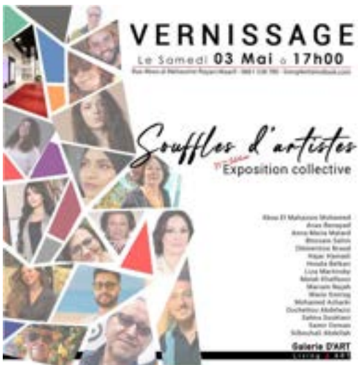
"Souffles d'artistes", 2025 Galerie Living 4 Art (Casablanca, Maroc)