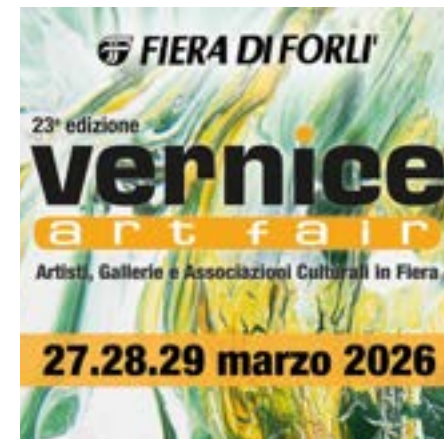
Foire d'art internationale de Forlì, 2026 (Forlì, Italie)